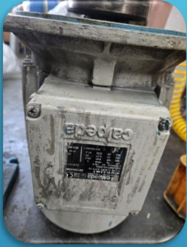
모터 수리 전 전경