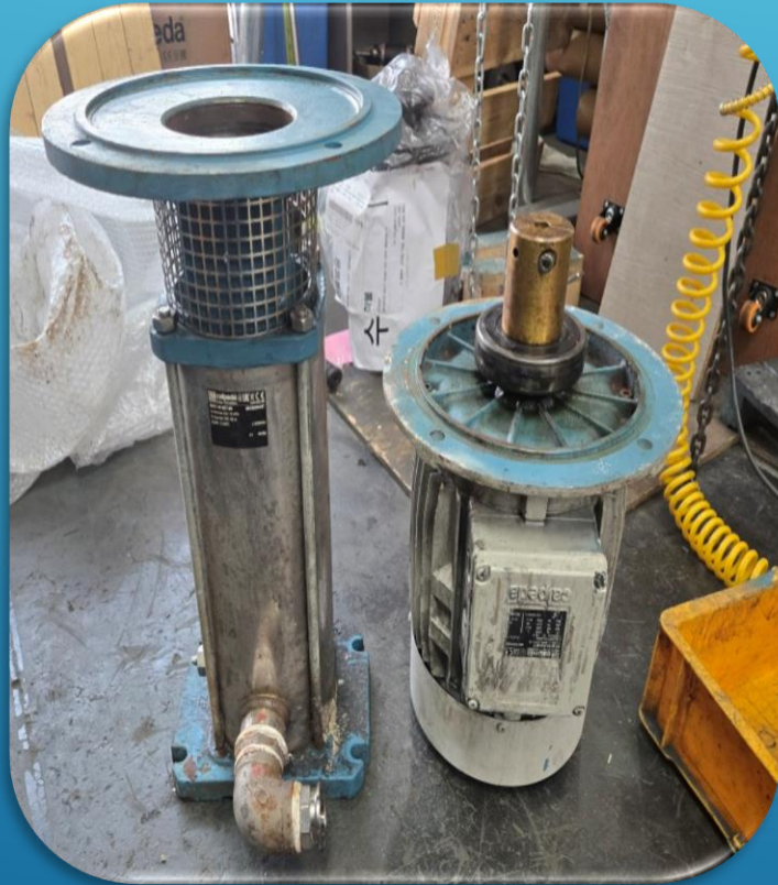
펌프 분해 전 전경