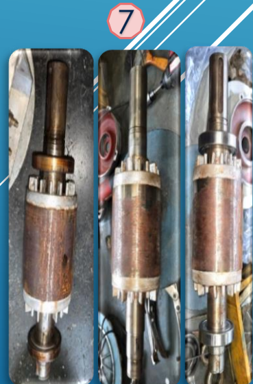
수리 완료 전경